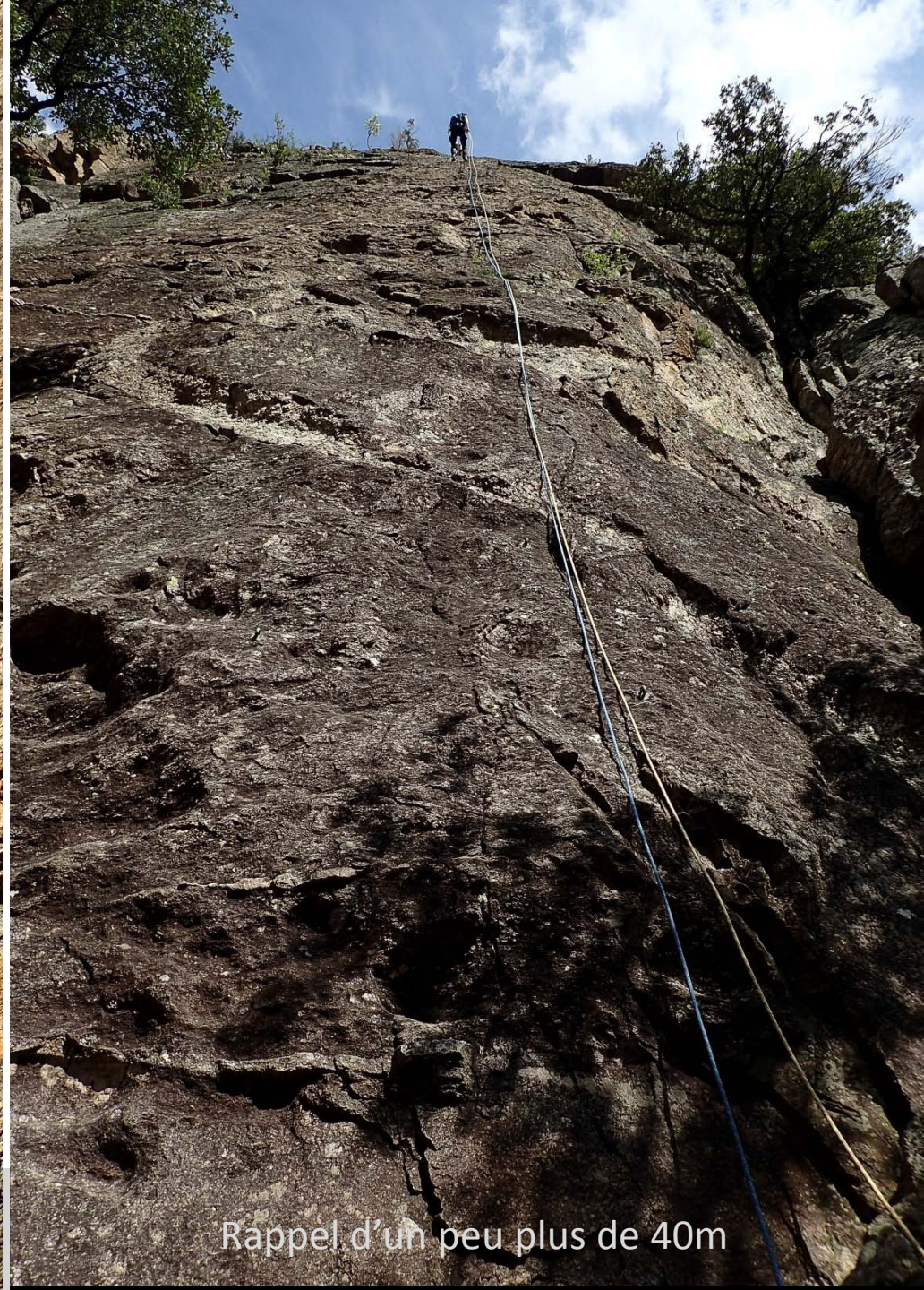
Rappel d'un peu plus de 40m