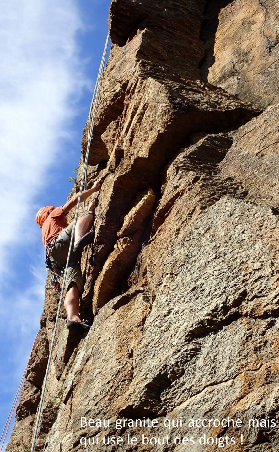
Beau granite qui accroche mais qui use le bout des doigts !